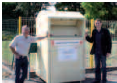
Installation de 7 colonnes textiles - été 2011 Partenaire: La Croix Rouge

La Communauté de communes est gestionnaire de la collecte et du traitement des déchets ménagers sur les 7 communes du territoire.